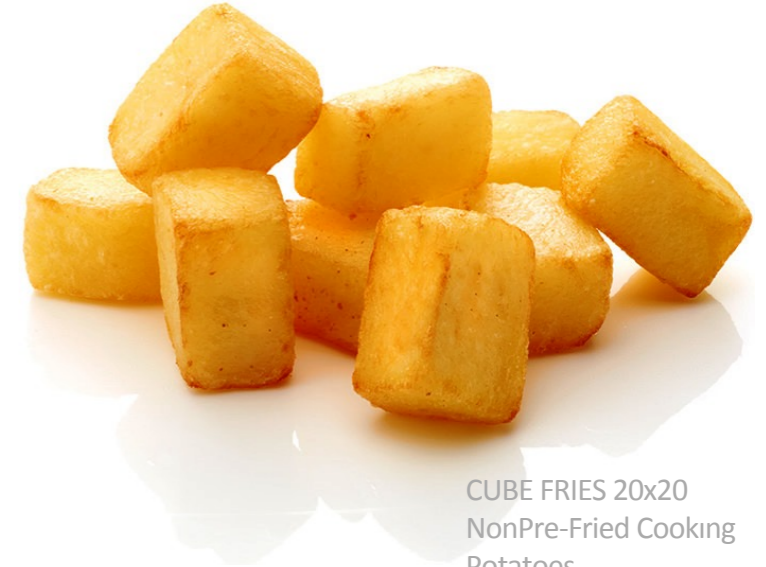
CUBE FRIES 20x20 NonPre-Fried Cooking Potatoes