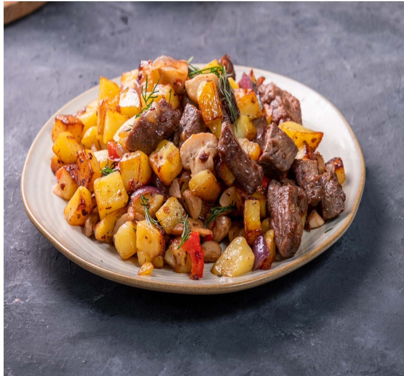
CUBE FRIES 10x10 NonPre-Fried Cooking Potatoes

KÜP KESİM PATATES 20x20 On Kızartma Yapılmamış Yemeklik Patates